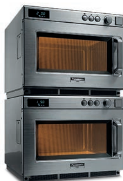
NE 1643 / 1843 / 2143-2