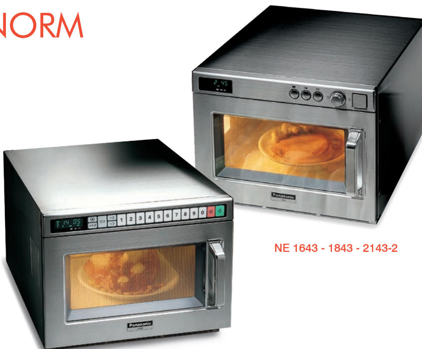
NE 1643 - 1843 - 2143-2